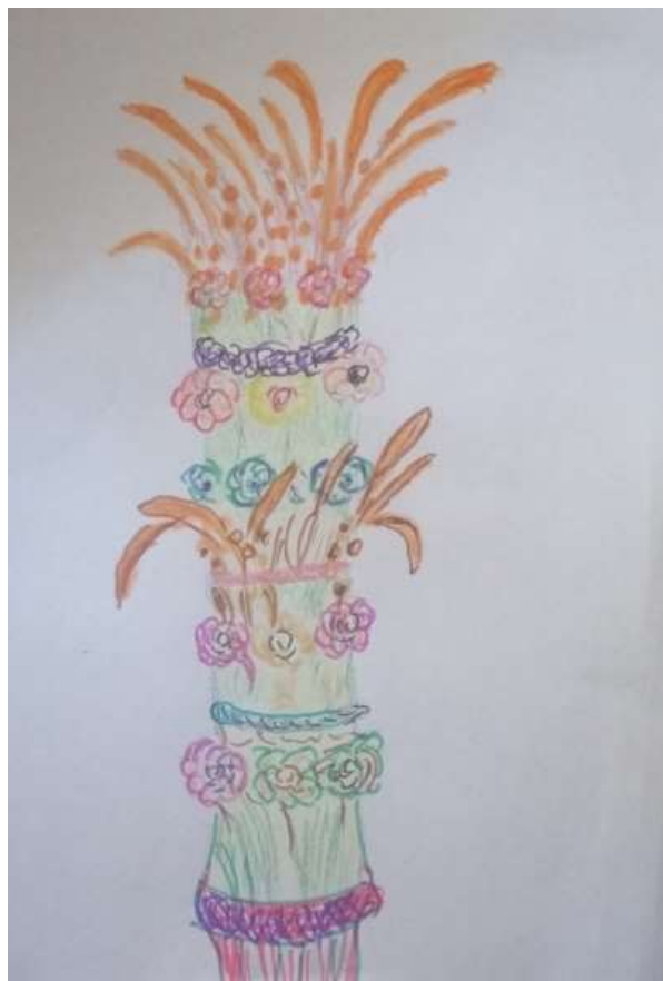
Praca Adama kl. 6